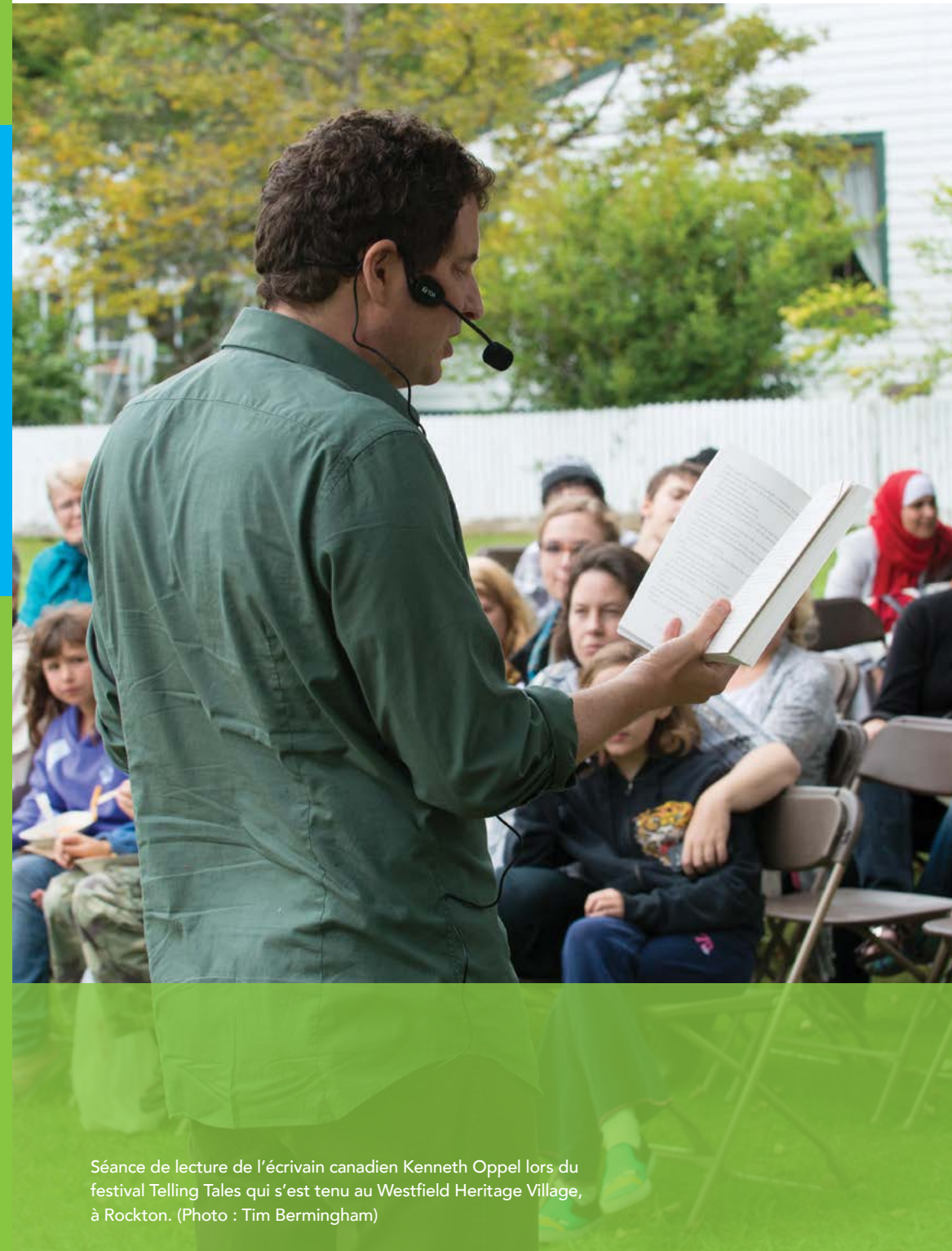
Séance de lecture de l'écrivain canadien Kenneth Oppel lors du festival Telling Tales qui s'est tenu au Westfield Heritage Village, à Rockton.