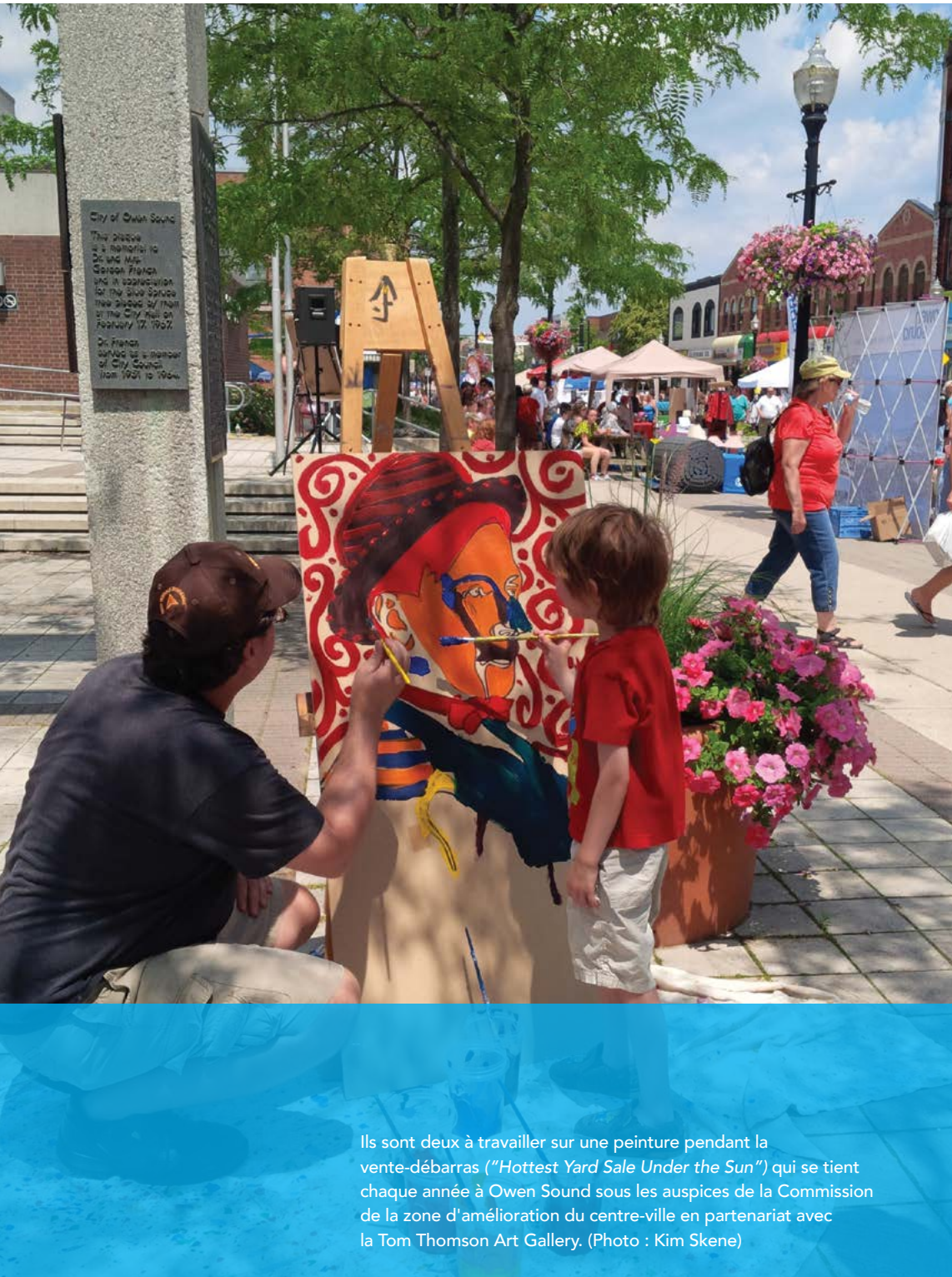
Ils sont deux à travailler sur une peinture pendant la vente-débaras ("Hottest Yard Sale Under the Sun") qui se tient chaque année à Owen Sound sous les auspices de la Commission de la zone d'amélioration du centre-ville en partenariat avec la Tom Thomson Art Gallery.