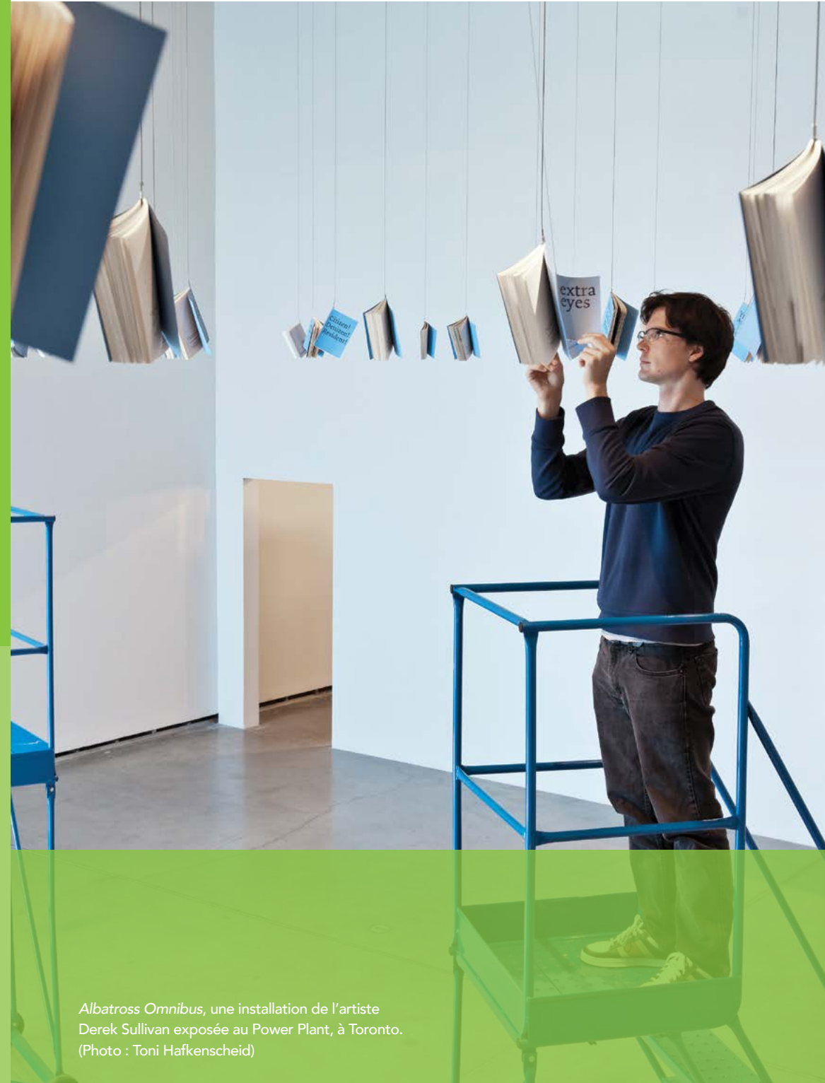
Albatross Omnibus , une installation de l'artiste Derek Sullivan exposée au Power Plant, à Toronto.