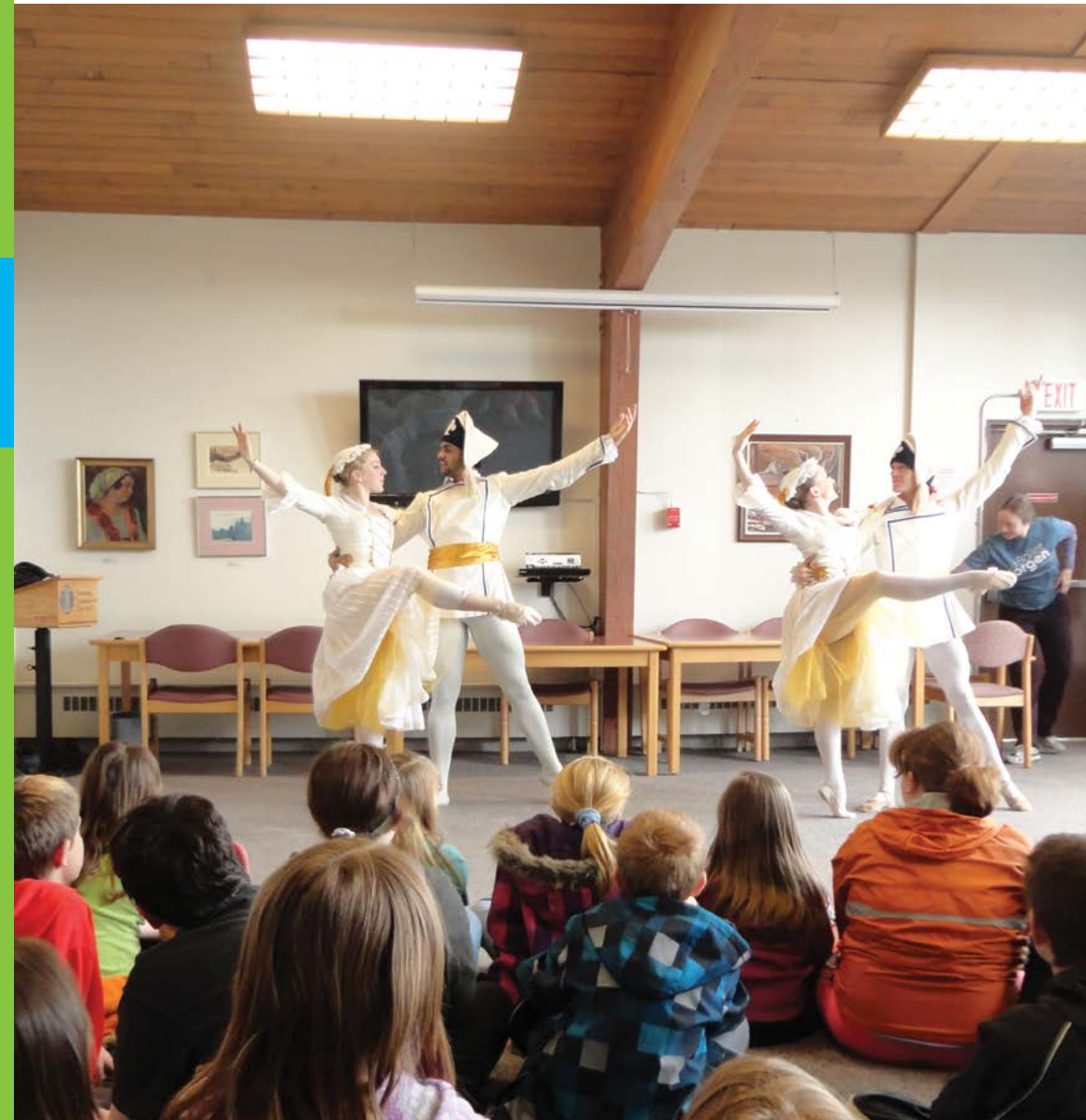
Des danseurs de Ballet Jörgen Canada ont fait une présentation sur les principes fondamentaux du ballet à la bibliothèque Izaak Walton Killam lors d'une tournée à Yarmouth, en Nouvelle-Écosse.