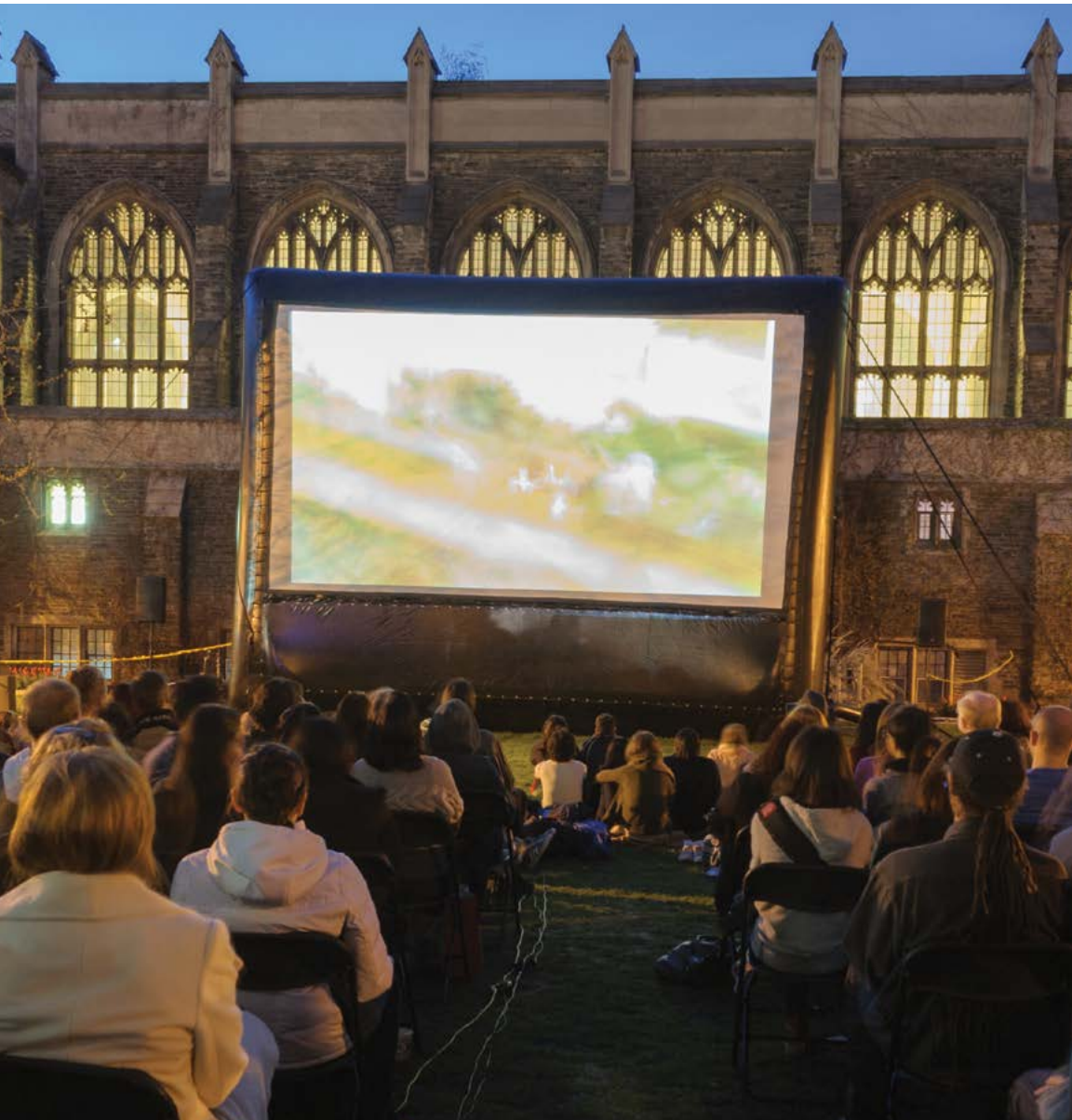
Projection du film Brothers Hypnotic , de Reuben Atlas, dans le cadre du programme Docs at Dusk du festival Hot Docs à Toronto.